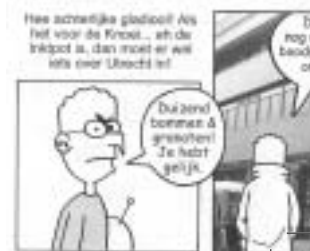
Ype Driessen in de Inktpot blz. 12